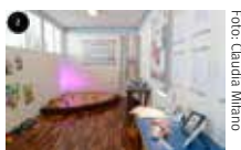
Foto 1 - Crianças em atividade ligadas às práticas pedagógicas. Foto 2 - Mostra Pedagógica que reuniu todos os trabalhos realizados em 2017.

Ao final do ano, no mês de novembro, durante a festa de 23º aniversário da ACTC - Casa do Coração, ocorreu a 6ª Mostra Pedagógica promovida pelo Departamento Desenvolvimento Pessoal e Inserção Social.