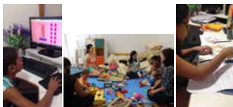
Crianças, adolescentes e mães/acompanhantes participaram ativamente dos trabalhos desenvolvidos no Reforço Escolar.

Em 2017 o Reforço Escolar manteve seu foco principal: Propiciar o desenvolvimento cognitivo, afetivo, social e ético das crianças e adolescentes atendidos na ACTC - Casa do Coração, oriundos de diversas cidades do Brasil e de alguns países da América Latina, afastados temporariamente dos bancos escolares para tratamento médico aqui em São Paulo.