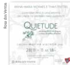
Rosa dos Ventos