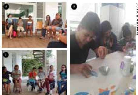
Foto 1 e 2 - Dois momentos do Projeto Leitura em Cena. Foto 3 - Atividade de Carnaval, com a produção de máscaras.

A interdisciplinaridade é uma importante ferramenta de atuação, pois contempla muitos benefícios para todos os setores envolvidos, além de enriquecer as propostas para as crianças.