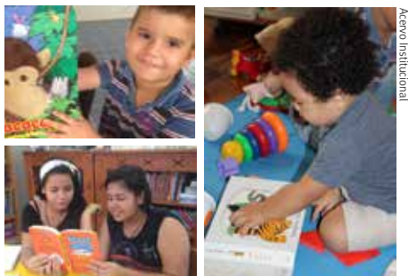
Promover a leitura e o contato com os livros foi o foco da Atividade Reforço Escolar no início de 2018.

“Leitura, antes de mais nada é estímulo, é exemplo.” (Ruth Rocha)