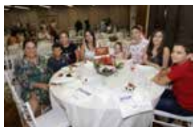
WIZO São Paulo

Crianças, adolescentes e educadoras da ACTC – Casa do Coração prestigiaram o evento comemorativo do Dia Internacional da Mulher, da Organização Wizo São Paulo.