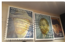
Visita à Exposição “Paisagens de Vicent van Gogh”.