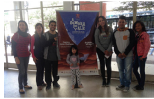
Espectáculo Teatral - A Sombra do Vale.