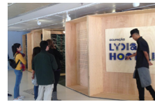
Visita à Ocupação Lydia Hortélio/ Mirante do SESC Paulista. Acervo Institucional

Como estratégia, foi elaborado um projeto voltado ao uso de espaços públicos e privados, considerados como extensão da Associação e do Hospital Foram feitas visitas e contatos, visando à formalização de parcerias e convênios- quando necessário. São Paulo é muito bem servida nesse sentido, tanto em relação a locais permanentes de atividades, como espaços para exposições temporárias.